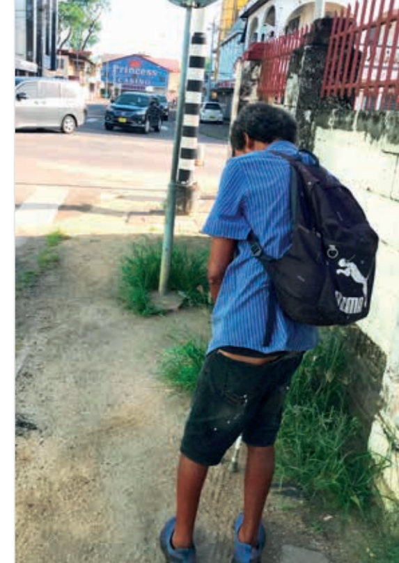
De bedelaar op de hoek van de Henck Arronstraat en de Stoelmanstraat

Een casinostaat, zo zou je Suriname ook kunnen noe-