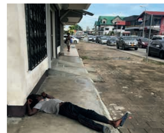
Rechts: de economische problemen in Suriname zijn groot

om minjan te maken, het tiental volwassen joodse mannen dat nodig is voor een godsdienstoefening. De Portugees-joodse gemeente ging samen met de Hoogduitse en de synagoge doet sindsdien dienst als computercentrum.