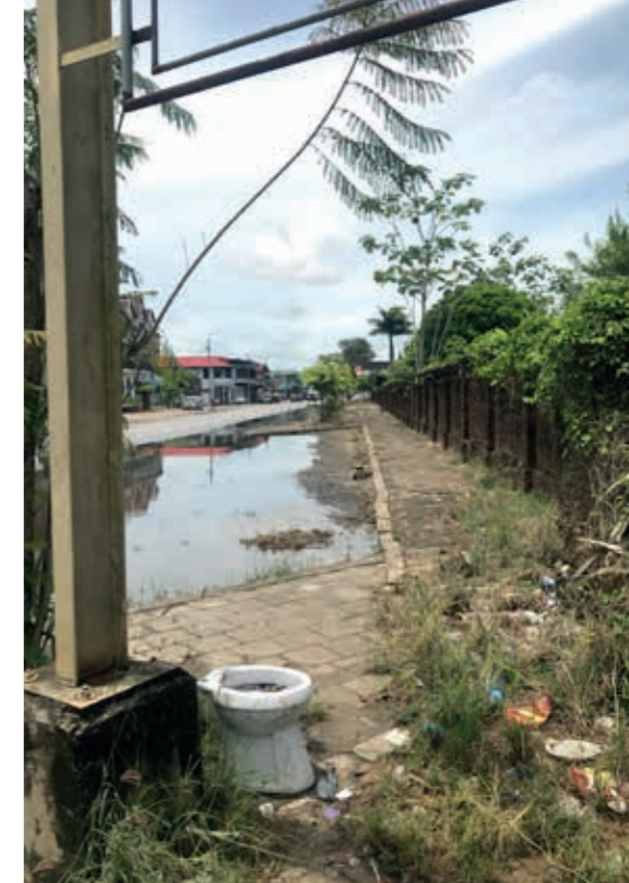
Boven: bij de Nieuwe Oranjetuin, de totaal overwoekerde oudste begraafplaats van de stad

Van die 500 waren er in 1995 niet genoeg meer over