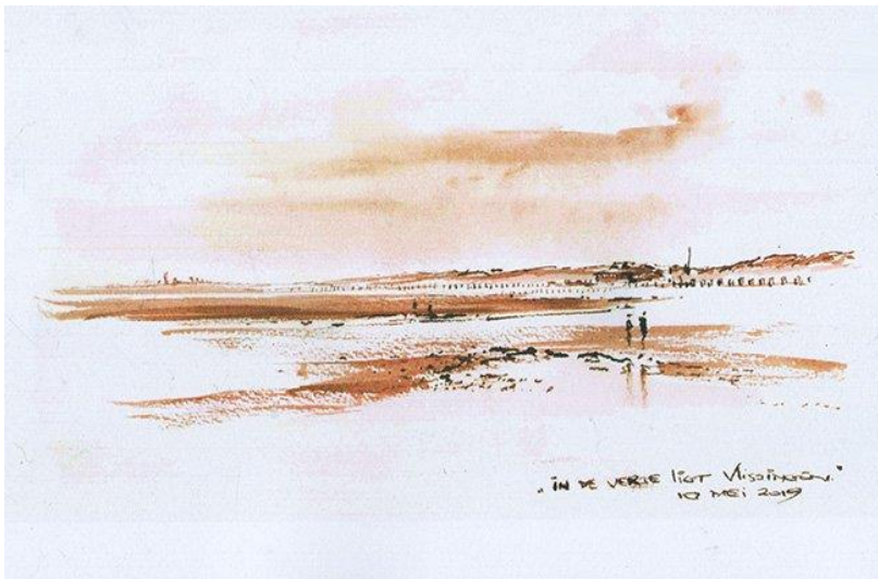
In de verte ligt Vlissingen, gewassen pentekening, 10 mei 2019