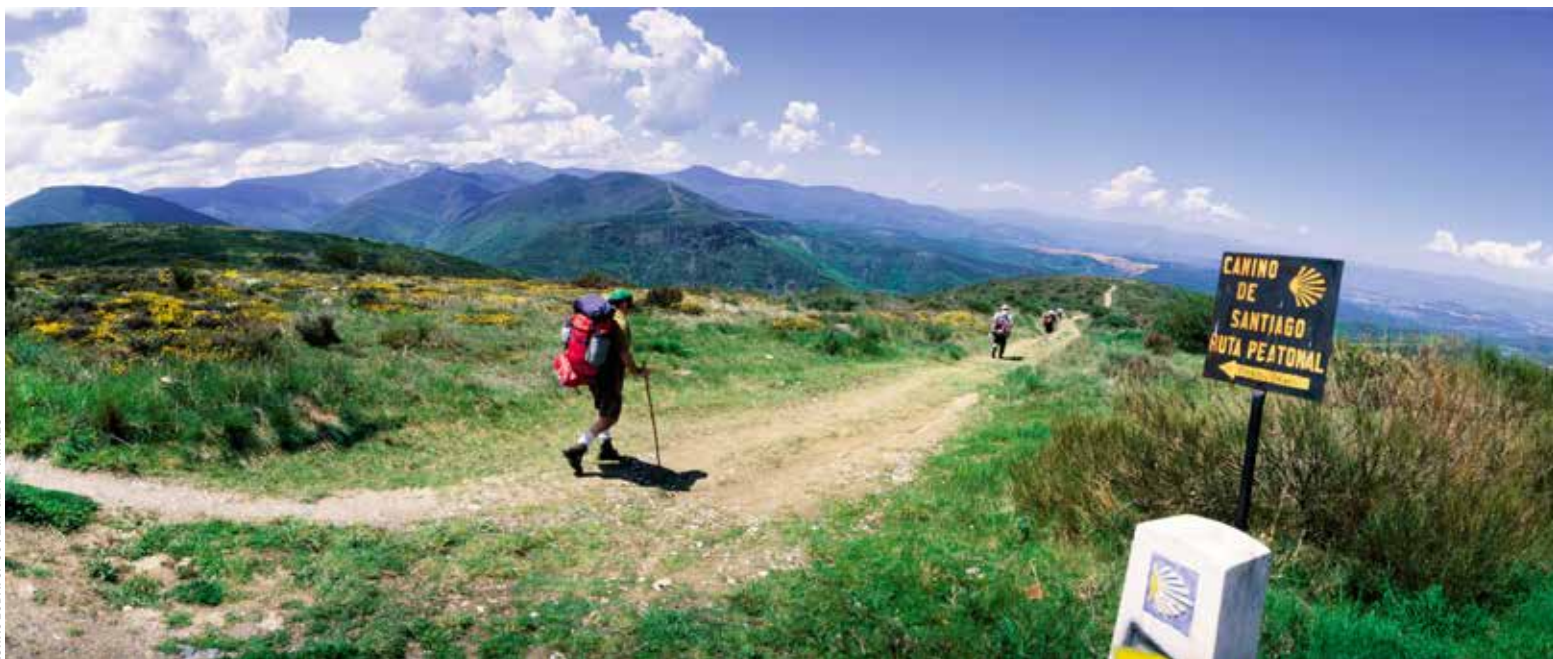
De voettocht is ook een reis terug naar eenvoud

geen bestemming is, maar een steeds wijkende horizon.